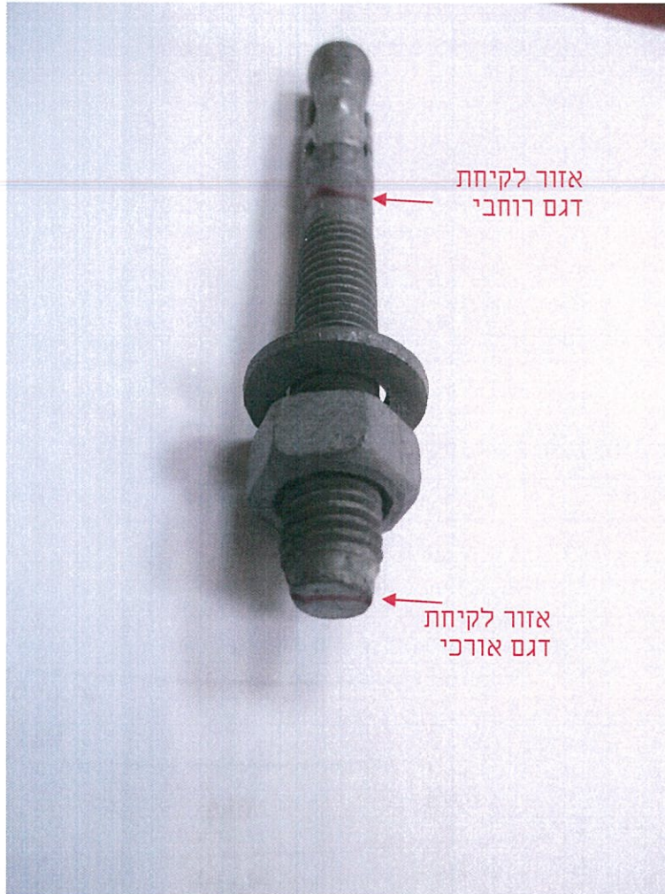
איור 1- תמונה כללית של החלק שהתקבל וסימון אזורי חיתוך לקבלת הדגמים המטלוגרפים.